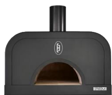
Habillage haut & conduit d'évacuation