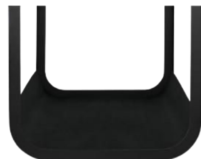
Piètement en option