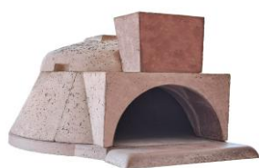
Four en kit L'Authentique Pizzaiolo