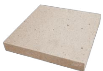
Sole en dalles de terre cuite