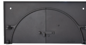
Façade Fonte avec porte à double battant