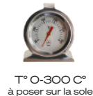
T° 0-300 C° à poser sur la sole