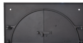
Façade Fonte avec porte à double battant

Tous nos fours sont garantis 5 ans et sont certifiés EN1388/1 (conforme à la mise en contact avec les denrées alimentaires).