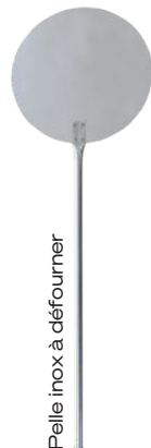
Pelle inox à défourner