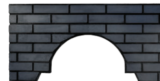
Façade Brique noire