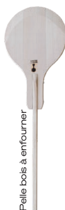
Pelle bois à enfourner