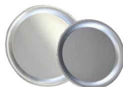
Plat alu 40 et 35 cm de diamètre