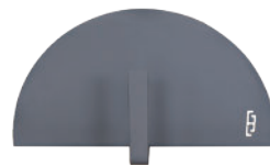
Mini porte acier