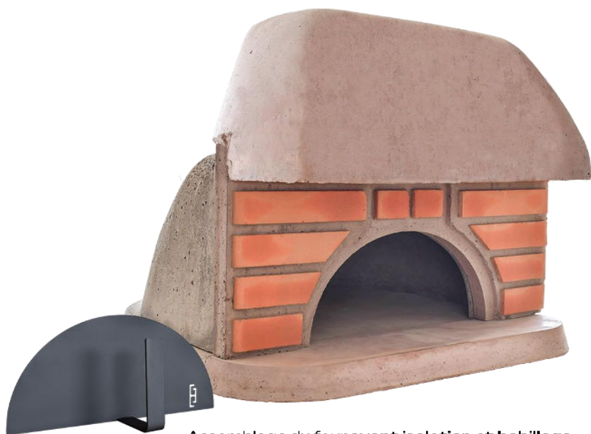
Assemblage du four avant isolation et habillage