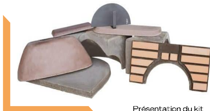
Présentation du kit